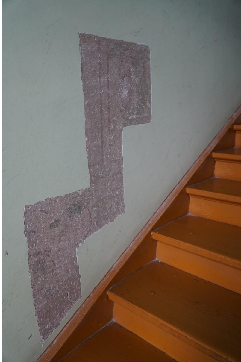
Fot.nr.8 Kraków ul.Pędzichów 21, Klatka schodowa- fragment dekoracji ścian , stan przed konserwacją. Wrzesień 2020r.