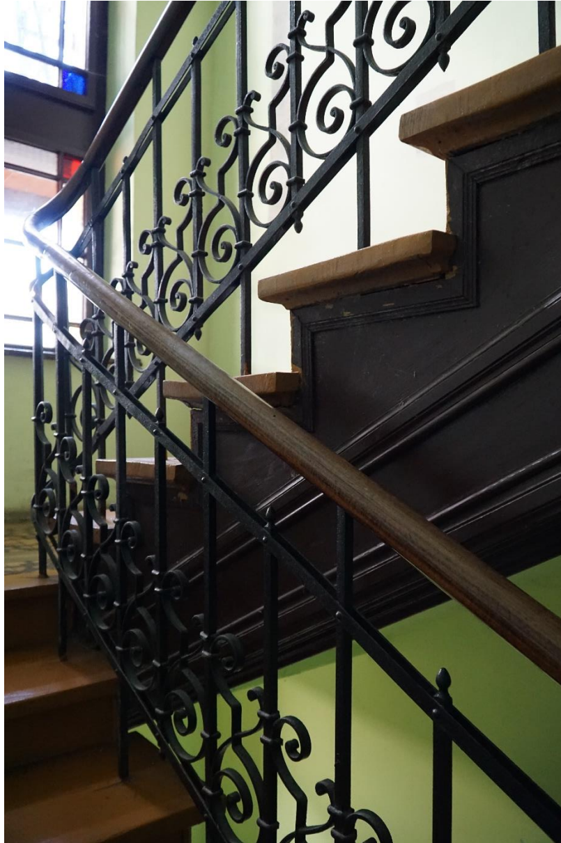
Fot.nr.5 Kraków ul.Pędzichów 21, Klatka schodowa- fragment balustrady , stan przed konserwacją. Wrzesień 2020r.