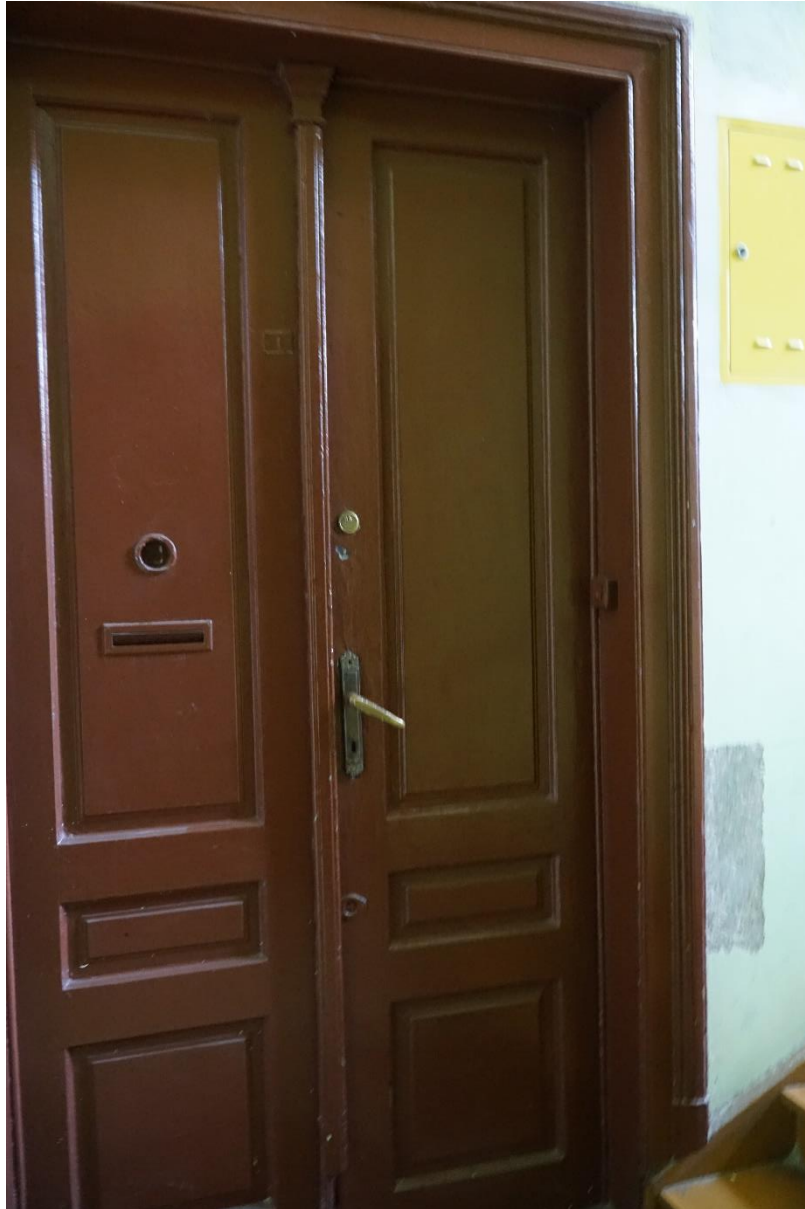
Fot.nr.9 Kraków ul.Pędzichów 21, Klatka schodowa- stolarka drzwiowa , stan przed konserwacją. Wrzesień 2020r.