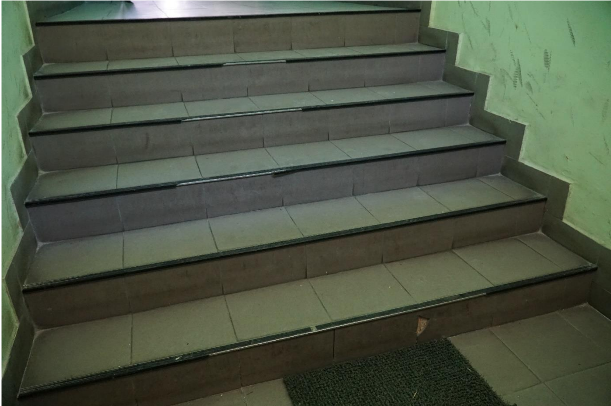
Fot.nr.2 Kraków ul.Pędzichów 21, Sień , stan przed konserwacją. Wrzesień 2020r. wyk.E Widerska