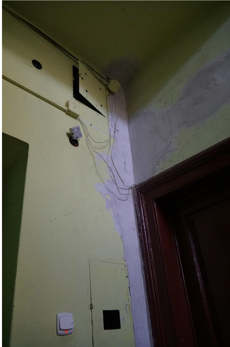
Fot.nr.11 Kraków ul.Pędzichów 21, Klatka schodowa , stan przed konserwacją. Wrzesień 2020r.