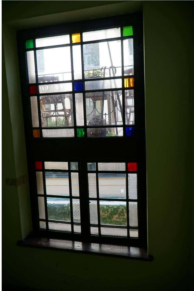
Fot.nr.10 Kraków ul.Pędzichów 21, Klatka schodowa- stolarka okienna , stan przed konserwacją. Wrzesień 2020r.