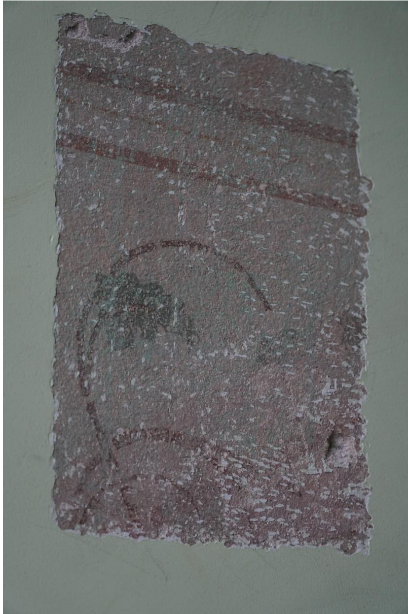
Fot.nr.7 Kraków ul.Pędzichów 21, Klatka schodowa- fragment dekoracji ścian , stan przed konserwacją. Wrzesień 2020r.