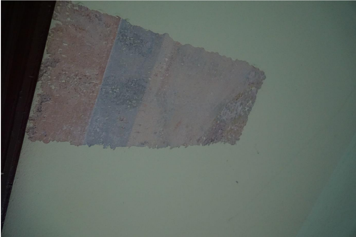
Fot.nr.9 Kraków ul.Pędzichów 21, Klatka schodowa- fragment dekoracji podniebia schodów, stan przed konserwacją. Wrzesień 2020r.