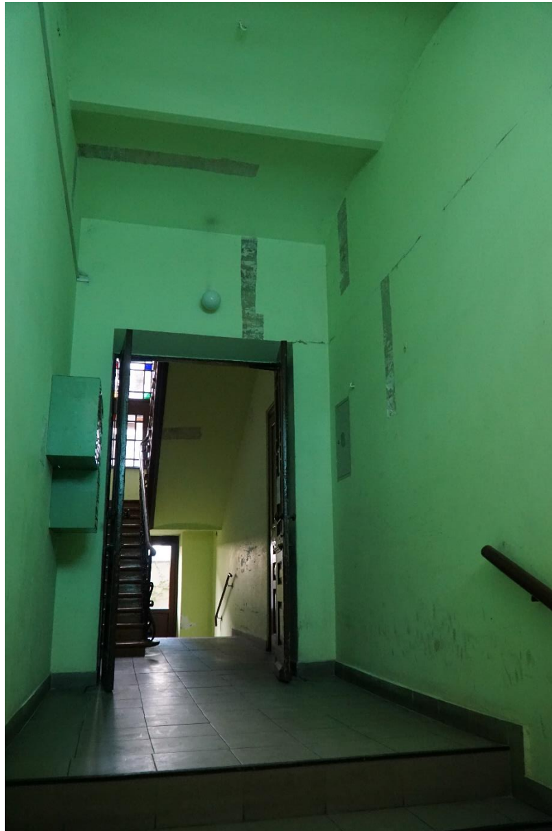
Fot.nr.1 Kraków ul.Pędzichów 21, Sień , stan przed konserwacją. Wrzesień 2020r. wyk.E Widerska