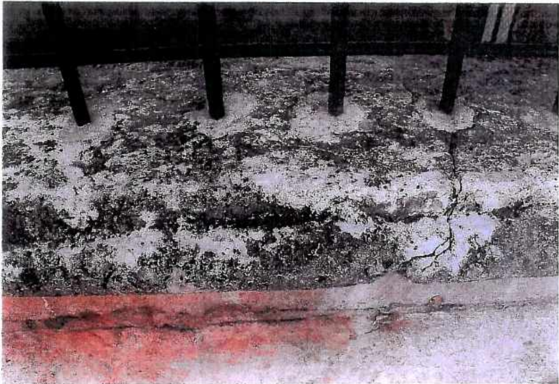
15. Kościół św. Barbary, Kaplica Ogrojцова, zbliżenie na na cios kamienny zewnętrzny. Stan przed konserwacją. wrzesień 2018r.