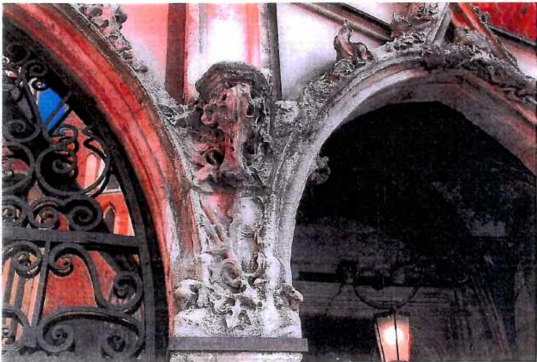
4. Kościół św. Barbary, Kaplica Ogrojцова, zbliżenie.. Stan przed konserwacją. wrzesień 2018r.