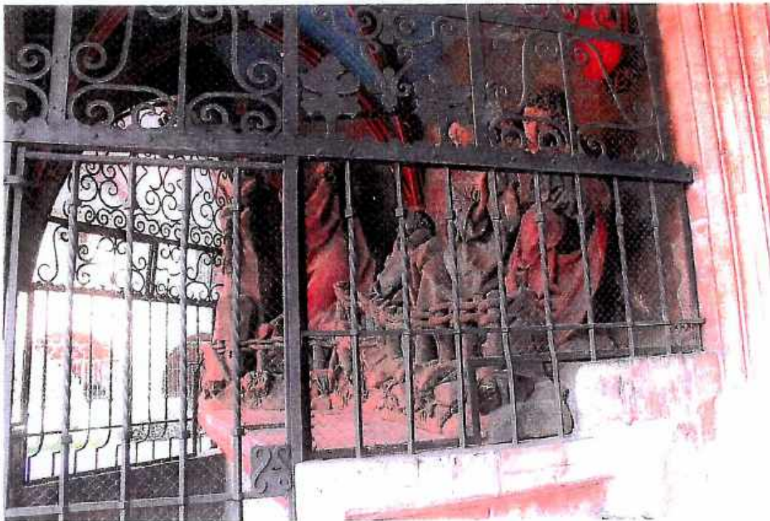
14. Kościół św. Barbary, Kaplica Ogrojцова, Widok wnętrz kaplicy poprzez kraty. Stan przed konserwacją. wrzesień 2018r.