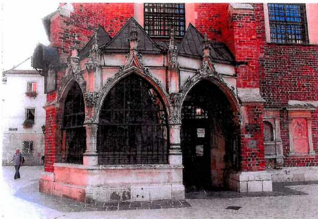
1. Kościół św. Barbary, Kaplica Ogrojcowa, widok ogólny od zachodu. Stan przed konserwacją. Fot. Sulisław Ćwiertnia ,wrzesień 2018r.