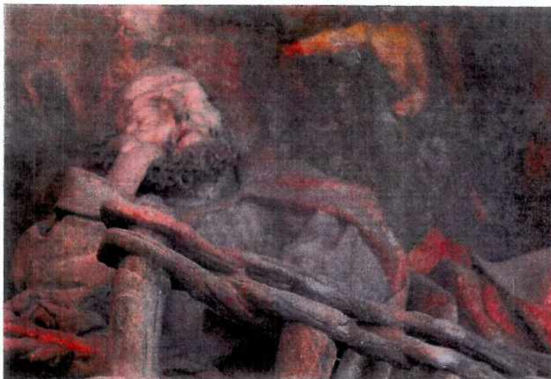
11. Kościół św. Barbary, Kaplica Ogrojcowa, figura św. Piotra, zbliżenie. Stan przed konserwacją. Fot. Sulisław Ćwiertnia ,wrzesień 2018r.