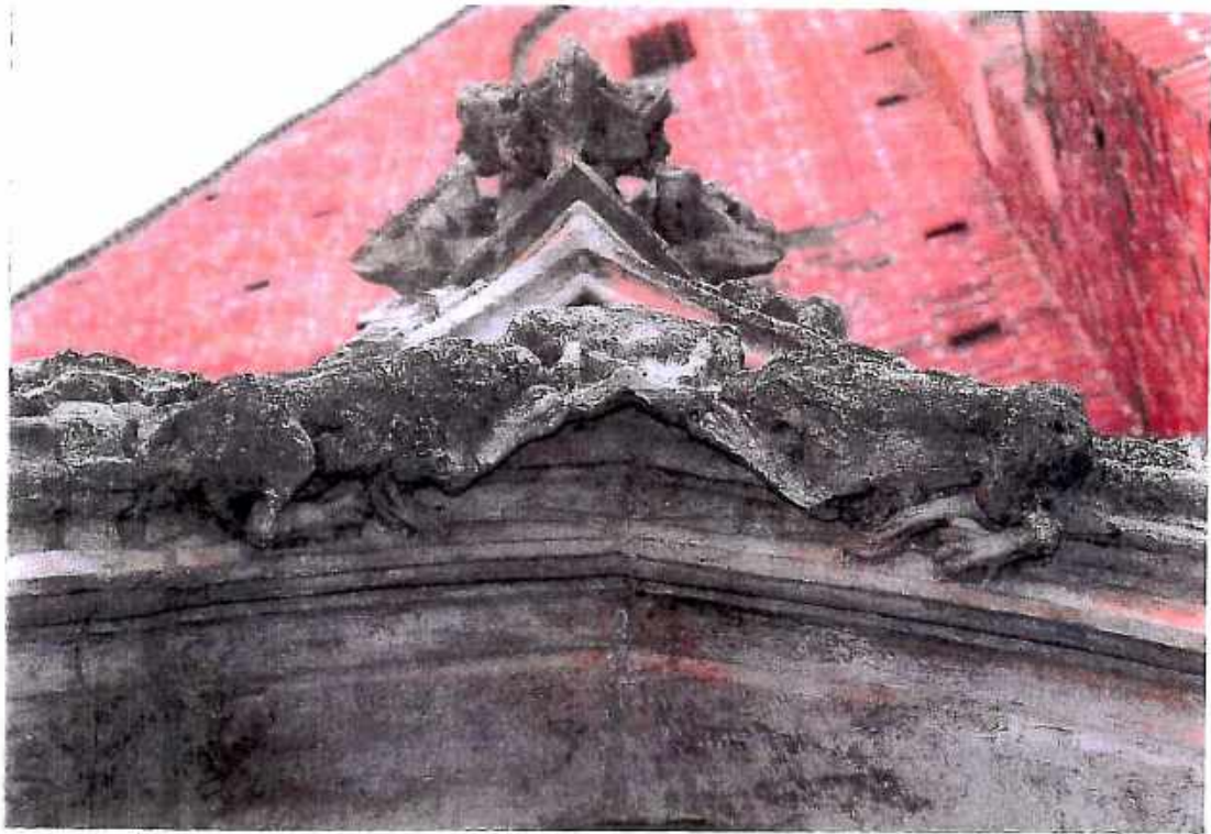
13. Kościół św. Barbary, Kaplica Ogrojцова, arkada wejściowa, fragment detalu lwy. Stan przed konserwacją. Fot. Sulisław Ćwiertnia ,wrzesień 2018r.