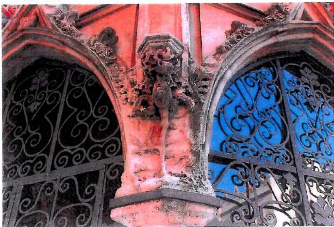
2. Kościół św. Barbary, Kaplica Ogrojcowa, zbliżenie . Stan przed konserwacją. wrzesień 2018r.