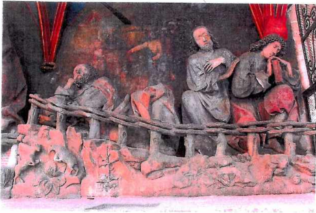
10. Kościół św. Barbary, Kaplica Ogrojcową, grupa figur apostołów Piotra, Jakuba i Jana. Stan przed konserwacją. wrzesień 2018r.