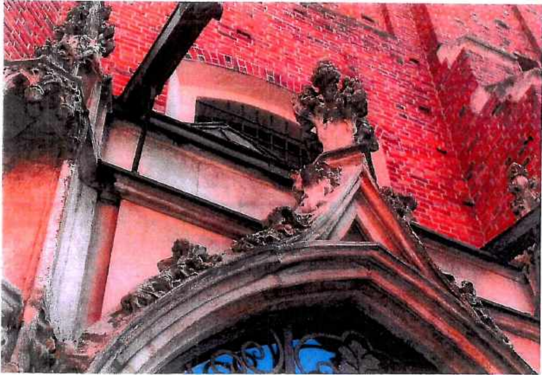
3. Kościół św. Barbary, Kaplica Ogrojцова, zbliżenie.. Stan przed konserwacją. Fot. Sulisław Ćwiertnia ,wrzesień 2018r.