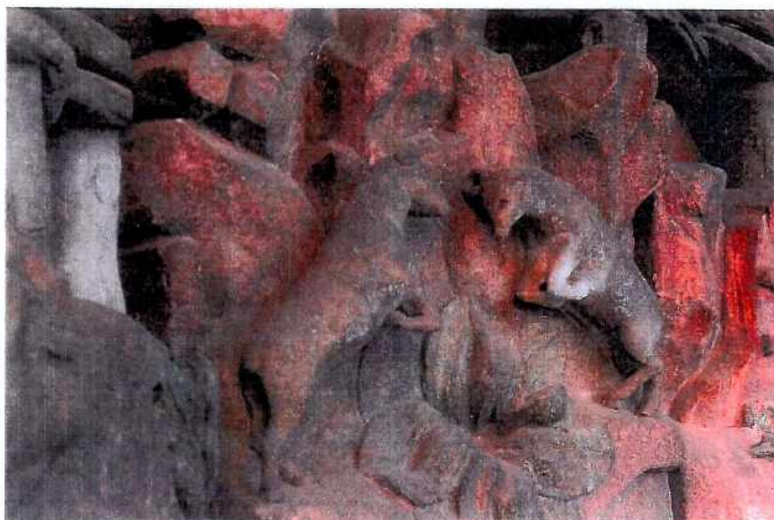
12. Kościół św. Barbary, Kaplica Ogrojcowa, fragment sceny zoomorficznej. Stan przed konserwacją. Fot. Sulisław Ćwiertnia ,wrzesień 2018r.