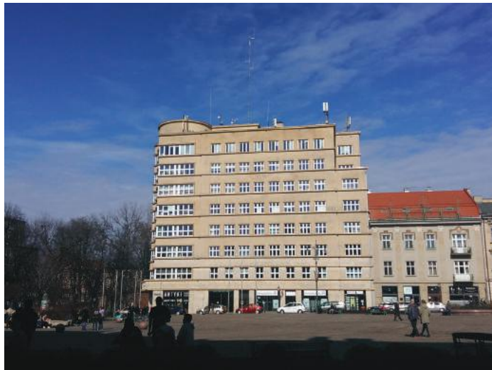
Elewacja budynku czyszczona (po raz pierwszy od ponad 70 lat) z użyciem różnych metod nie jest idealnie jednolita, ale dzięki temu zachowuje szlachetny wygląd oryginału.

Pamiętaj: Nie wszystkie przebarwienia da się usunąć. Efekt „przeczyszczenia” powierzchni jest niekorzystny nie tylko z przyczyn estetycznych, prowadzi też do nieodwracalnego uszkodzenia wykrystalizowanej w procesach chemicznych ochronnej, zewnętrznej, ochronnej warstewki tynku. Dlatego źle wykonany zabieg prowadzić będzie w dalszej perspektywie czasowej do zniszczenia substancji.