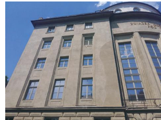
Uzupełniony „kopia tynku” spory ubytek ulegnie w miarę upływu czasu scaleniu z resztą elewacji.

Uwaga: nawet jeśli skład zaprawy jest dokładnie taki, jak tynku historycznego, finalny efekt uzupełnienia zawsze będzie inny, ponieważ tynk oryginalny uległ na przestrzeni dziesięcioleci przemianom, których nie da się odtworzyć.