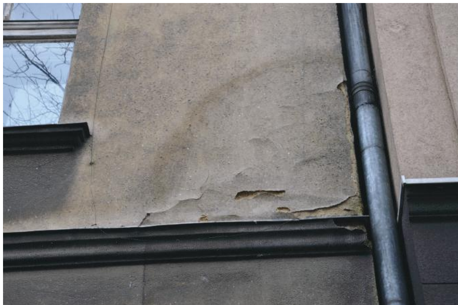
Odspojenie tynku na dużej powierzchni na skutek uszkodzenia rury spustowej.

Osobnym objawem zniszczeń są spękania tynku, rozspojenia (na granicy warstw technologicznych) i odspojenia (na granicy tynk – podłoże). Do ich powstawania przyczyniają się przede wszystkim czynniki mechaniczne (wstrząsy, opłukiwanie wodą) oraz chemiczne związane z degradacją strukturalną tynku np. przemian chemicznych.