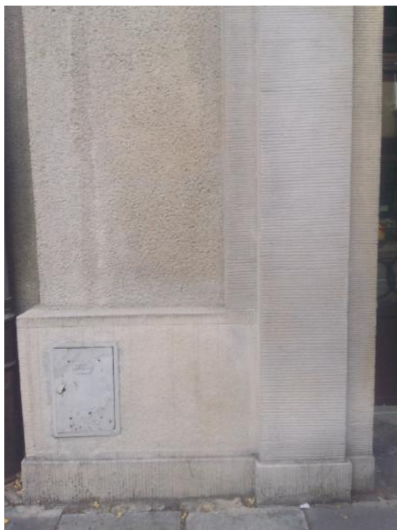
Fragment elewacji po wykonaniu uzupełnień i ich scaleniu.

Zabieg na pewien czas zabezpiecza powierzchnię przed penetracją wilgoci, nie wpływając na prawidłową cyrkulację pary wodnej. Hydrofobizacja zapobiega zniszczeniom wynikającym z przedostawania się wody w głąb tynku i osadzeniu się zabrudzeń. Trwałość powłoki zależy od rodzaju produktu i wynosi kilka lat. Oznacza to, że zabieg należy powtarzać, podobnie jak pokrywanie tynku preparatami antygraffiti.