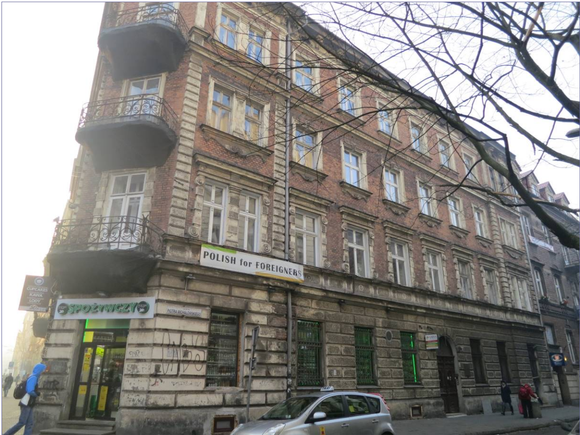
fasada budynku od strony ul. P. Michałowskiego.

W obrębie parteru i na bokach ryzalitów tynkowane powierzchnie są boniowane. Ich powierzchnia jest wyraźnie urozmaicona odcisniętą fakturą. Tynkowane powierzchnie pomalowano farbą w kolorze szaro ugrowym, imitującym kamień. Tym samym elementy te zostały wyodrębnione kolorystycznie z ceglanej powierzchni elewacji.