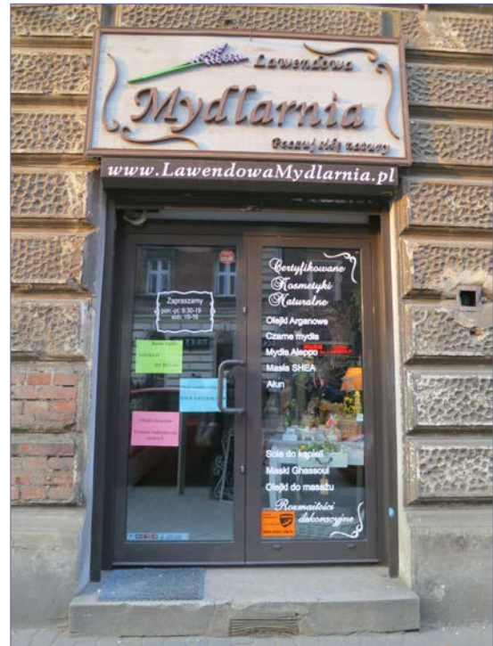
Współcześnie osadzone okna i drzwi w elewacji wschodniej, w narożniku oraz w ryzalicie narożnika od strony północnej oraz szyldy sklepów zawieszane nad drzwiami wejściowymi.