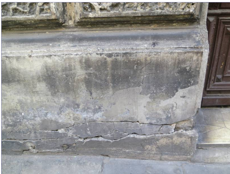
Znaczne spękania kumulują się w obrębie i nad cokołem, co świadczy o osłabieniu zapraw spowodowanym zasoleniem.

Największe uszkodzenia wypraw tynkowych występują w partiach cokołowych i pierwszej bonii, nad nimi. Tam też założono najwięcej zapraw naprawczych cementowych.