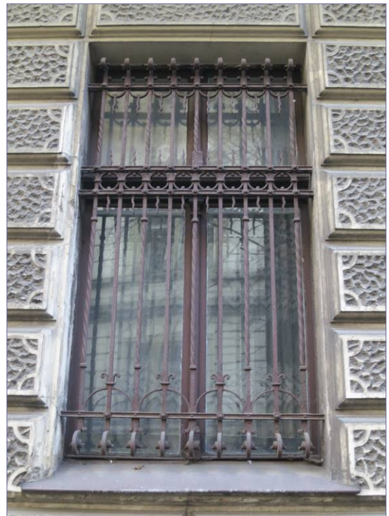
brama wejściowa i okna parteru od ul. Michałowskiego