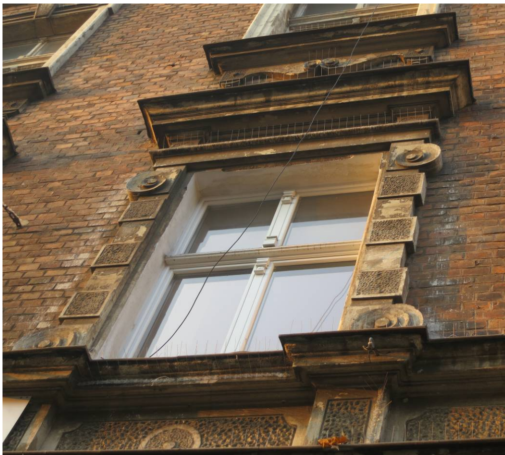
zabrudzenia guanem elewacji, luźno zwisające kable

Uszkodzone obróbki blacharskie stały się przyczyną znacznych uszkodzeń profilowanych gzymsów, nadproży i profilowanych opasek okiennych. Na skutek zawilgacania i przemrażania w okresie zimowym wyprawy uległy spękaniu.