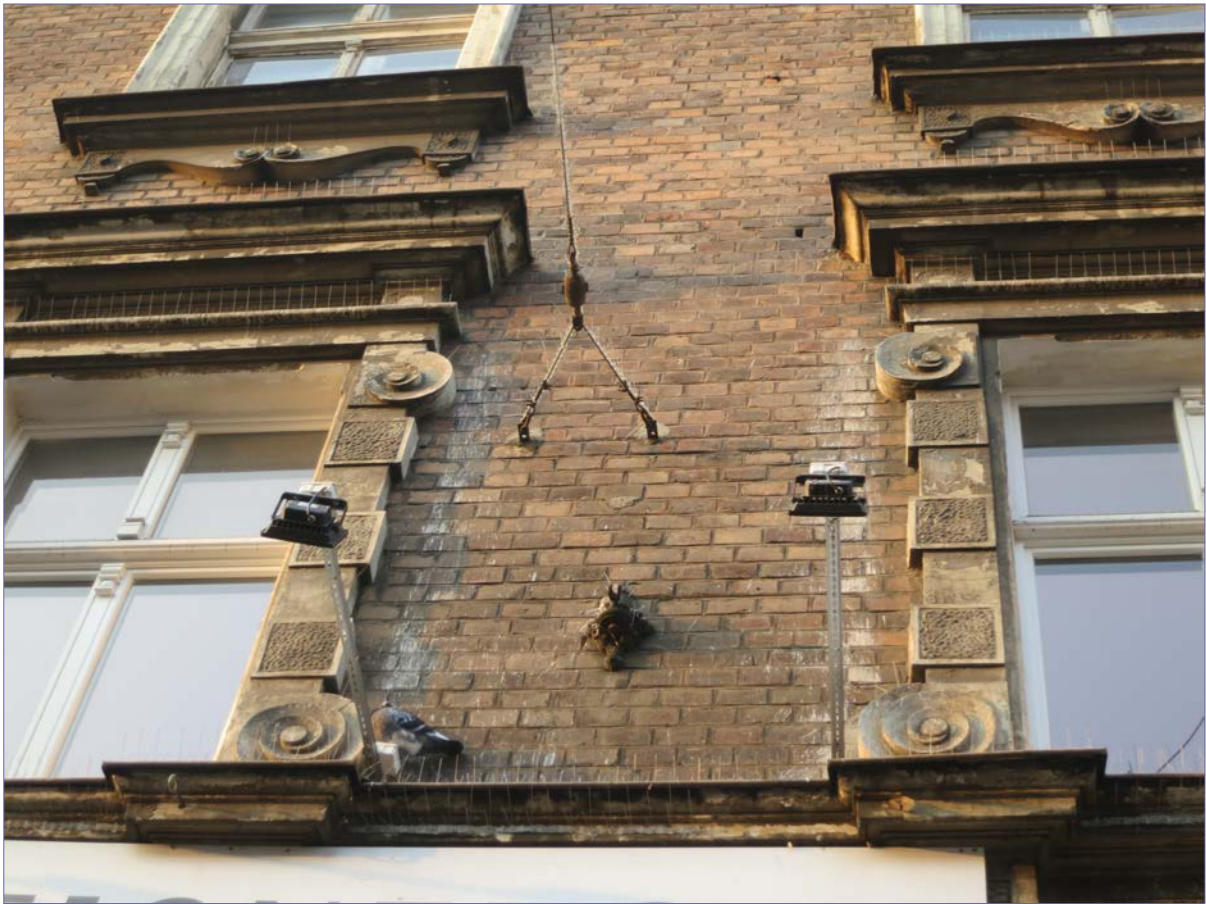
ciemne smugi zabrudzeń i białe zacieki widoczne na ceglach elewacji wzdłuż okien I piętra

Kolorystyka cegieł jest oryginalnie melanzowa, choć różnice zabarwienia pogłębia jeszcze stopień zniszczenia lica i utrata odporności na wnikanie zabrudzeń w głąb materiału. Na niektórych pojedynczych ceglach widoczne są zniszczenia w postaci utraty i osypywania się lica (spieku) i znacznego wykruszenia krawędzi. Generalnie jednak stan zachowania cegieł jest dobry.