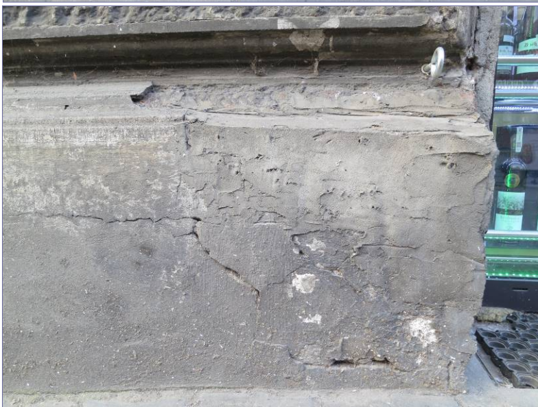
Miejscowe uzupełnienia tynku zaprawą cementową w obrębie cokołu w miejscach najbardziej narażonych na zniszczenie.

W obrębie cokołu zostały wymienione okienka piwniczne. Od strony ul. P. Michałowskiego na plastikowe w kolorze brązowym, osadzone na piance montażowej. Od strony ul. Karmelickiej tymczasowo zostały zasłonięte płytami pilśniowymi. Wokół okienek widoczne są rozległe ubytki tynku i widoczny wątek ceglany muru.