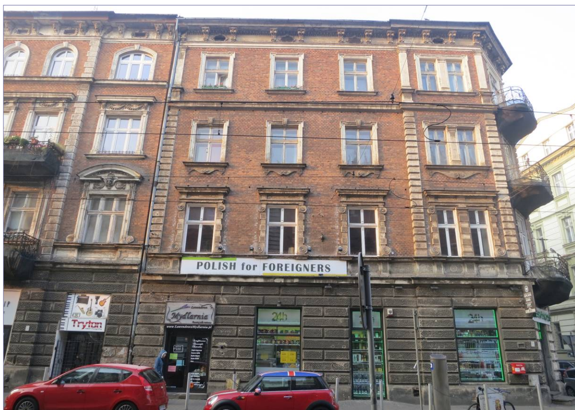
fasada budynku od strony ul. Karmelickiej

Ściany kamienicy wymurowano z cegieł maszynowych, ceramicznych, łączonych zaprawą wapienno-piaskową. Elewacja na I, II i III kondygnacji licowana jest cegłą klinkierową w kolorystyce czerwonej – niejednolitej kolorystycznie. Okładzina posiada fugowanie płaskie, wyciskane narzędziem, lekko wgłębne w stosunku do lica cegieł z zaprawy wapienno-piaskowej z dodatkiem składników hydraulicznych w kolorze cegły, znacznie zabrudzone.