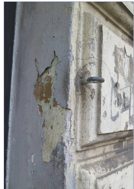
przemalowania powierzchni boniowanych farbami w kolorze szarym i ugrowym