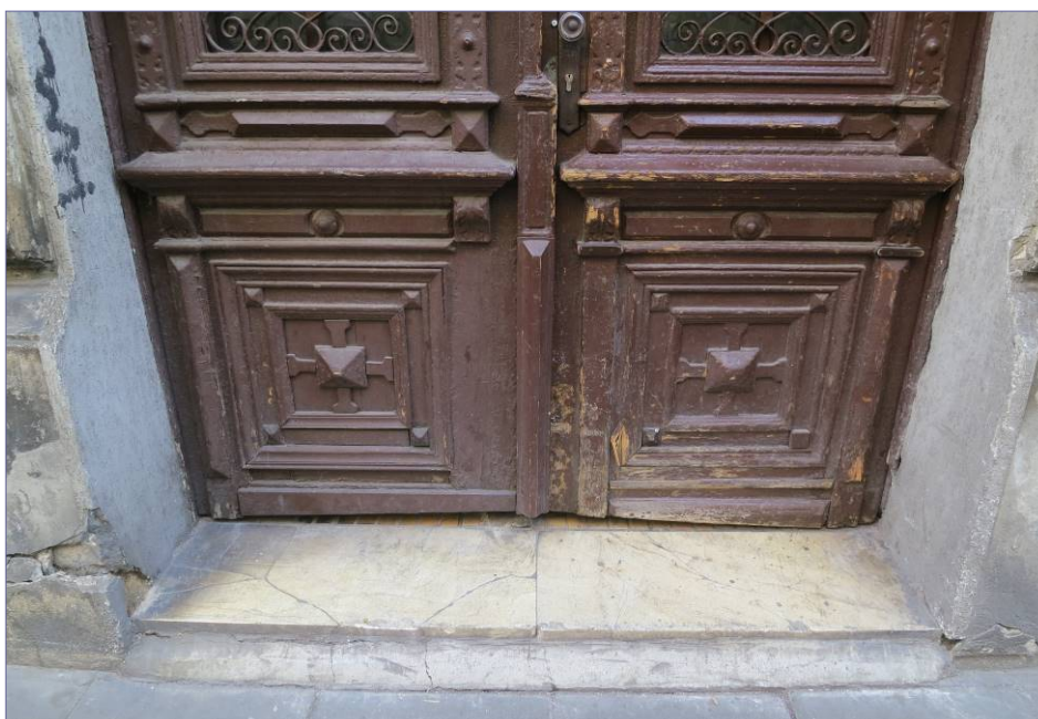
Zniszczony kamienny próg wejściowy przy drzwiach od ul. Michałowskiego; degradacja kamienia, silne spękanie i zabrudzenia powierzchni.

Kamienny próg i schodek przy drzwiach wejściowych od ul. Michałowskiego jest bardzo spękany. W wielu miejscach widoczne są uszkodzenia mechaniczne. Powierzchnia kamienia jest silnie zabrudzona, z widocznymi ubytkami i wykruszeniami. Widoczne są ciemne plamy, zacieki powierzchni.