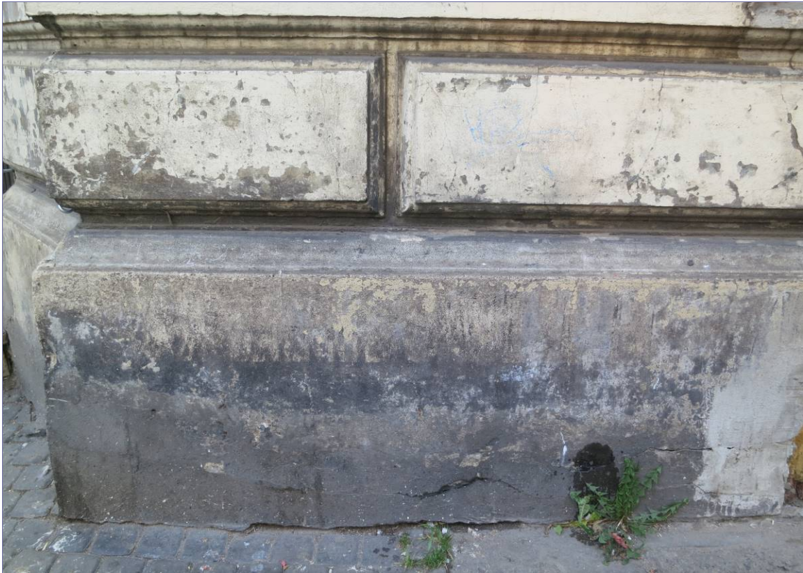
stan zachowania cokolu i najniżej położonych bonii, widoczne liczne warstwy przemalowań, cementowe uzupełnienia ubytków tynku, silne spękania tynku.