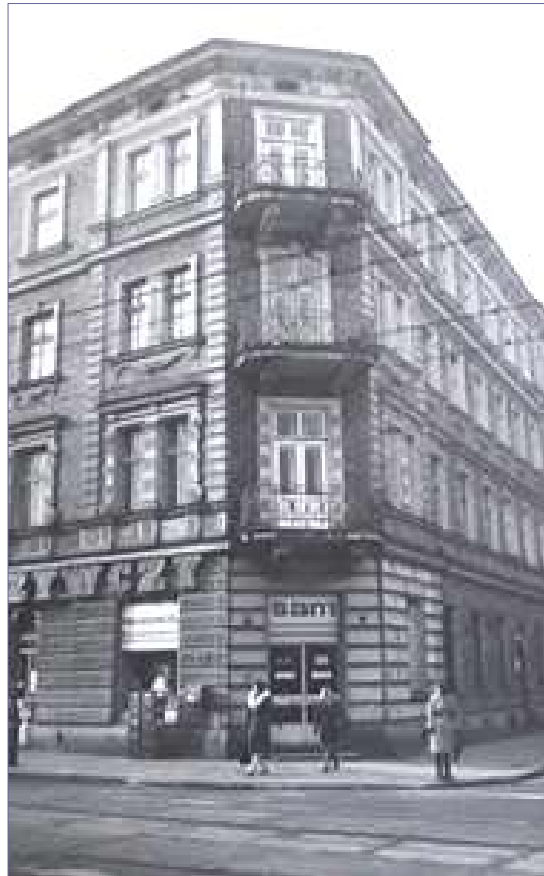
Balkony na narożniku kamienicy – stan obecny i zdjęcie archiwalne z 1977r.

Historyczne elementy metalowe wystroju – kute kraty w oknach, bariery balkonów, kraty osłaniające przeszklenia w drzwiach wejściowych są zabrudzone i mocno skorodowane. Pokrywająca je farba jest przetarta, złuszczone i nie zabezpiecza należycie wrażliwej powierzchni metalu. Miejscowo widoczna jest rdza, która koroduje metalową powierzchnię. Brak niektórych metalowych elementów – np. fragmentu kraty w drzwiach wejściowych.