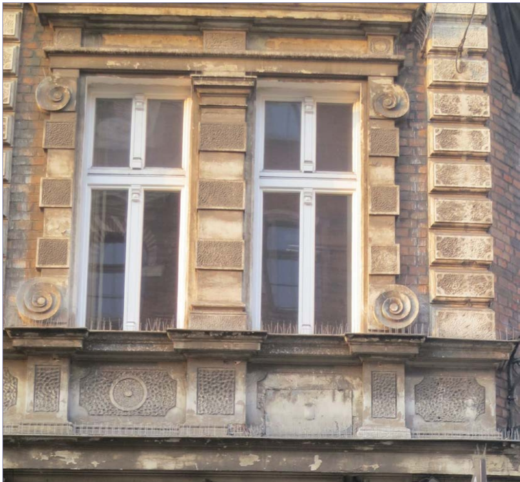
Stolarka okienna piętér zróźnicowana, pomalowana na biało.