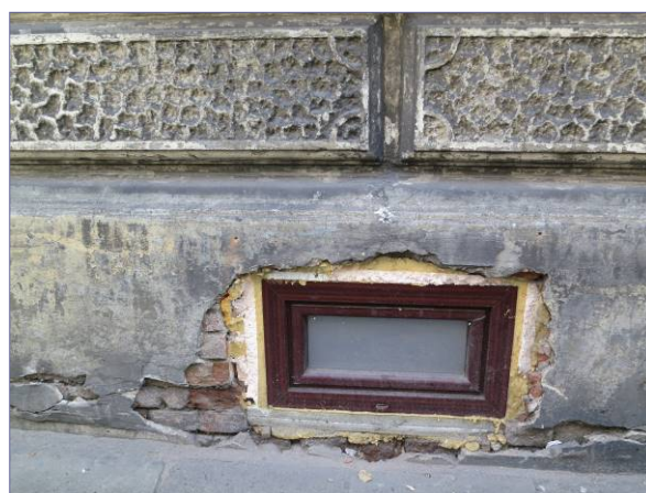
okienka w obrębie cokółu od strony ul. Karmelickiej i ul. Michałowskiego