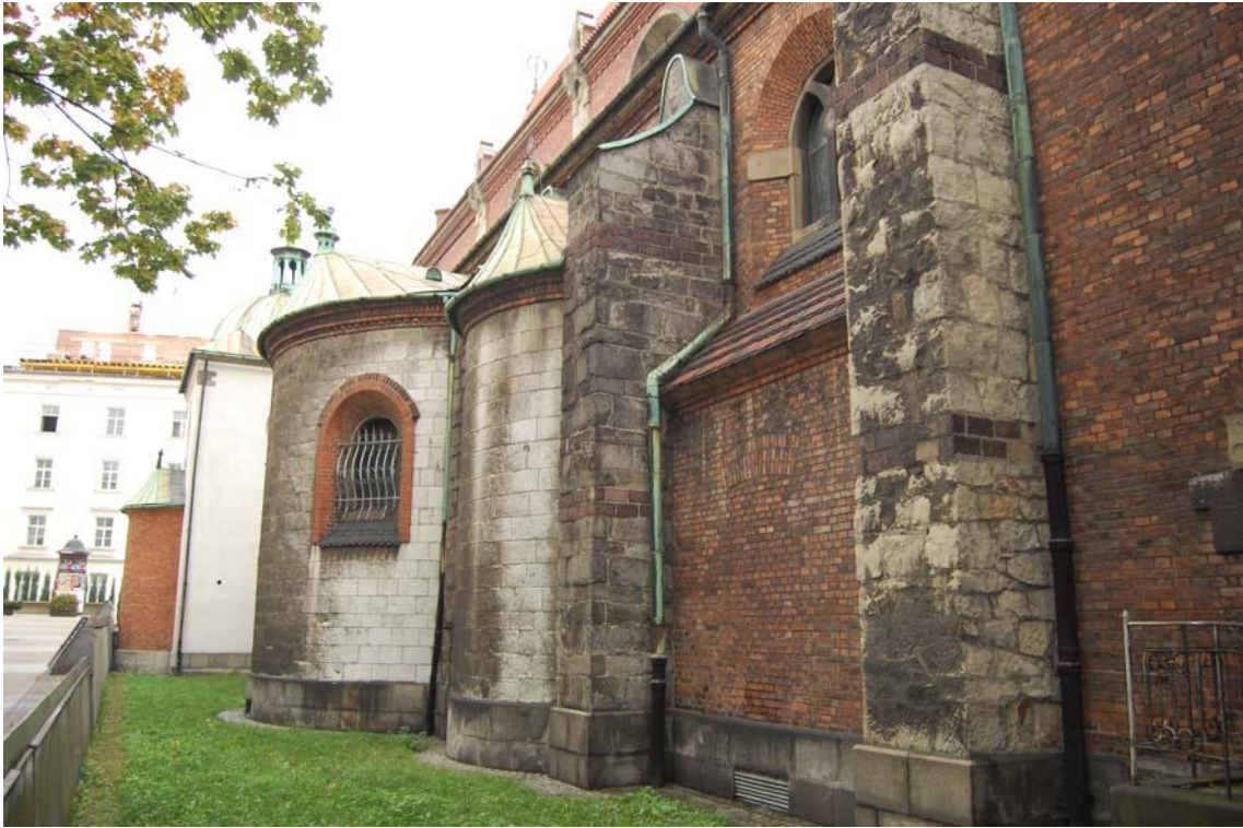
Fot 9 elewacja północna – widok ogólny