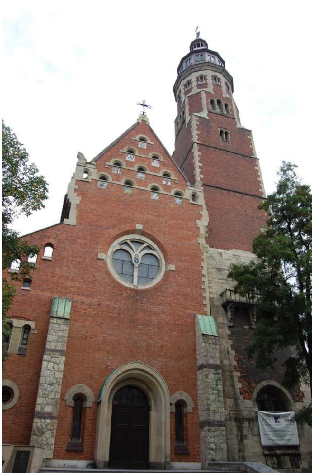
Fot 8 – elewacja frontowa widok ogólny