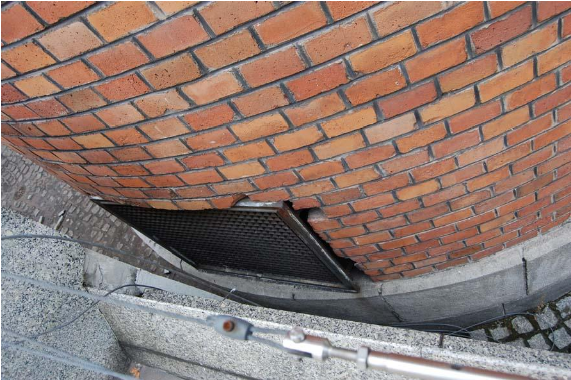
Fot 12 – otwór wykuty w celu montażu okienka z kratownicą w obrębie wątku absydy kaplicy Ducha Świętego