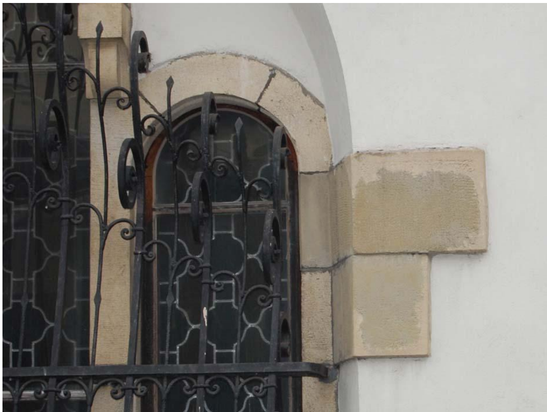
Fot 13 - Elewacja północna zakrystii – widoczne przebarwione kity w obrębie kamieniarki okien.