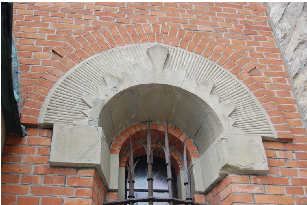
Fot 3 – nadproże okna w elewacji frontowej – widoczne złuszczenia i wymycie powierzchni kamienia i zmienione kolorystycznie kity