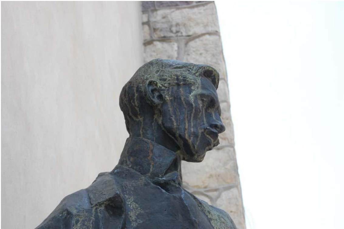
Fot 7 – fragment pomnika Franciszka Mączyńskiego – widoczne zacieki i korozja powierzchni metalu