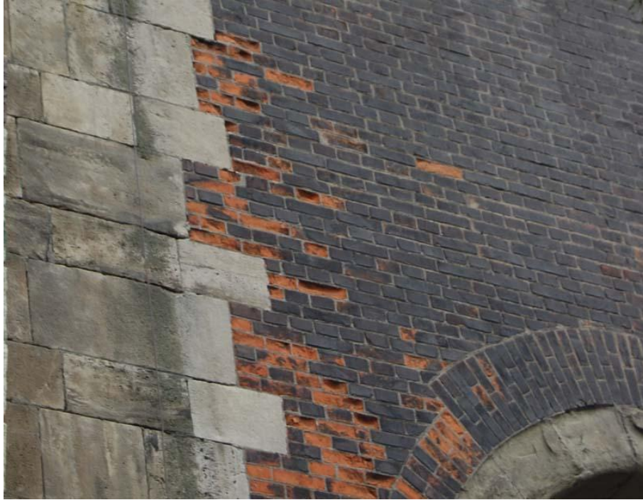
Fot 2 – watek ceglany elewacji zachodniej wieży – widoczna czarna patyna i głębokie ubytki cegieł