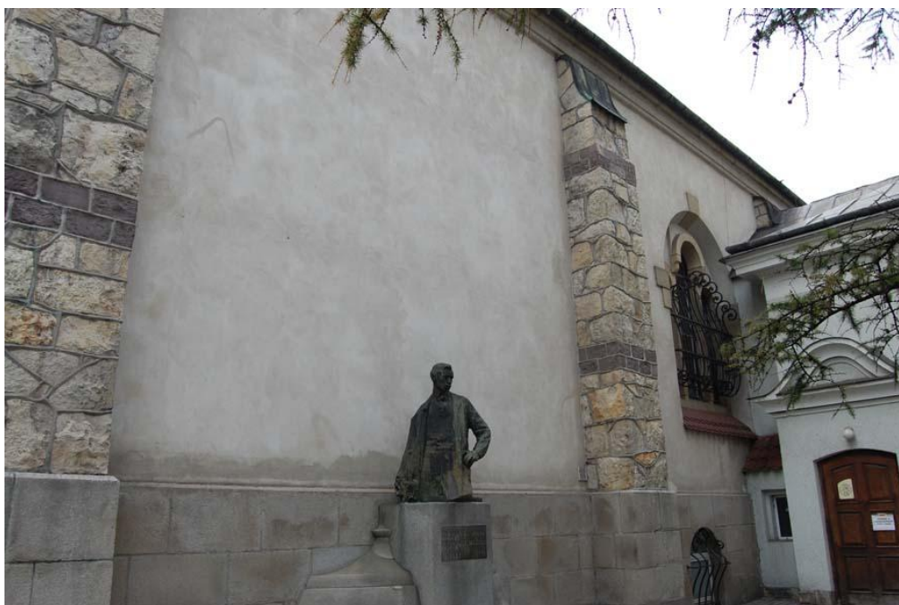
Fot 6 – elewacja wschodnia zakrystii – widoczne wtórne tynki, nieestetyczne i zawilgocone

Tynki elewacji Zakrystii są w całości wtórne. Położone nierówno, z widocznymi śladami zacierania a miejscami spękane i odspojone – w związku z zawilgoceniem powodowanym nieszczelnością obróbek blacharskich - sprawiają bardzo niekorzystne estetycznie wrażenie.