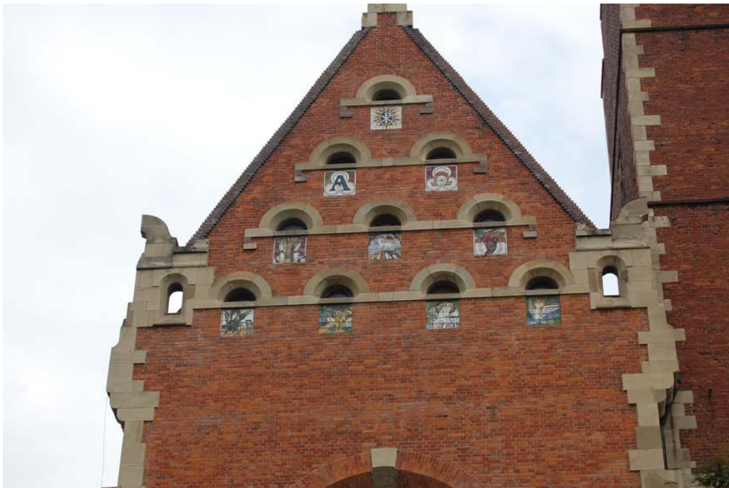
Fot 1 – elewacja frontowa – szczyt – widoczne odbarwienie spoin malowanych na czarno i zmienione kolorystycznie uzupełnienia wiatku

Wątek ceglany w obrębie frontowej elewacji budynku poddany był pracom konserwatorskim w ubiegłych latach. Jego stan zachowania pod względem technicznym jest dobry. Wymaga jednak korekty estetycznej – praktycznie na całej powierzchni elewacji doszło do wypłukania czarnej farby, podkreślającej testowanie spoin, a ponadto uzupełnione kitem ubytki w obrębie cegieł uległy przebarwieniom.