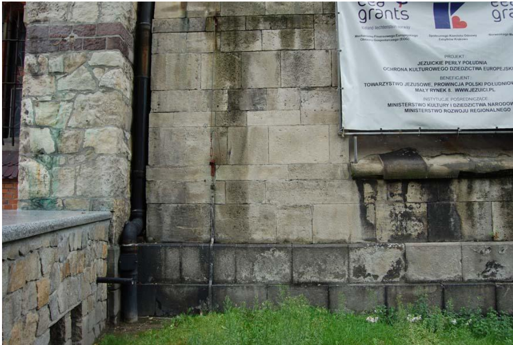
Fot 4 – okładzina dolomitowa elewacji zachodniej wieży – widoczne zabrudzenie kamienia, lokalne wymycie powierzchni, wykruszenie spoin